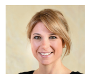
Greta Gysin Nationalrätin TI @gretagysin

Es ist klar: Auf die Herausforderungen des Bevölkerungswachstum – sei es beim Wohnen, beim Verkehr oder beim Umweltschutz – reagieren wir GRÜNE mit solidarischen Lösungen! Diese Initiative tut das Gegenteil. Sie stiftet Chaos und schürt den Hass auf andere. Wir sagen deshalb laut und deutlich Nein am 14. Juni!