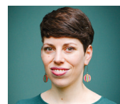
Lisa Mazzone Präsidentin GRÜNE Schweiz @lisazzone

Darum ist klar: Es braucht jetzt einen klaren, verbindlichen und sozial gerechten Fahrplan für den Abschied aus dem fossilen Zeitalter. Die GRÜNEN werden daher alle politischen Mittel für den Fossilausstieg unter anderem im Verkehrs- und Gebäudesektor einsetzen. Ohne Klimaschutz gibt es keine soziale Gerechtigkeit. Und ohne Fossilausstieg gibt es keine Souveränität.