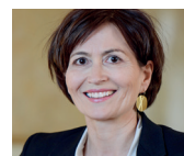
Regula Rytz présidente des VERTS suisses, conseillère nationale BE @RegulaRytz

populistes de droite ont longtemps minimisé la crise sanitaire, alors que toujours plus d'autocrates se plaisent à construire des murailles et à instaurer le droit d'urgence. C'est pourquoi les prochains mois seront déterminants, non seulement pour l'économie durable mais aussi pour l'Etat de droit et la démocratie. Et les Verts de toute l'Europe doivent jouer le rôle décisif de rempart contre l'autoritarisme. Engageons-nous, ensemble !