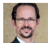
Balthasar Glättli président du groupe parlementaire @bglattli

des milliers de procédures. Les ajournements, de même que les crédits aux PME sont certes utiles pour faire face au manque de liquidités. Mais ils ne résolvent pas le problème, ils ne font que le déplacer.