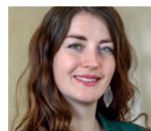
Léonore Porchet conseillère nationale VD @LeonorePorchet

l'angle mort de la politique fédérale, notamment une meilleure protection des travailleurs et travailleuses, des garderies, des mesures en faveur de la santé mentale, un renforcement du système de santé publique.