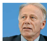
Jürgen Trittin Bundestagsabgeordneter Bündnis 90/Die Grünen 1998 – 2005 Bundesminister für Umwelt, Naturschutz und Reaktorsicherheit @JTrittin

Wer nicht auf die Anti-AKW-Bewegung hört, wer nicht umsteigt – den bestraft der Markt. Der wird künftig massiv von Energieimporten abhängig werden. Wer dem entgegen möchte, muss sich aufmachen. Aussteigen aus Atom und Einsteigen in die Erneuerbaren.