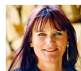
Christine Häslér Nationalrätin BE, Mitglied Initiativkomitee @Chrige_Haesler

Attraktive Arbeitsbedingungen, bessere Aus- und Weiterbildungsmöglichkeiten und individuelle und familienfreundliche Arbeitsmodelle sollen dafür sorgen, dass mehr junge Menschen und WiedereinsteigerInnen Pflegeberufe wählen. Die Pflege verdient als zentrales Element der medizinischen Versorgung unsere volle Unterstützung. Es ist selbstverständlich, dass sich viele Grüne für die Initiative engagieren und ich mich auch in der Gesundheitskommission mit aller Kraft dafür einsetzen werde.