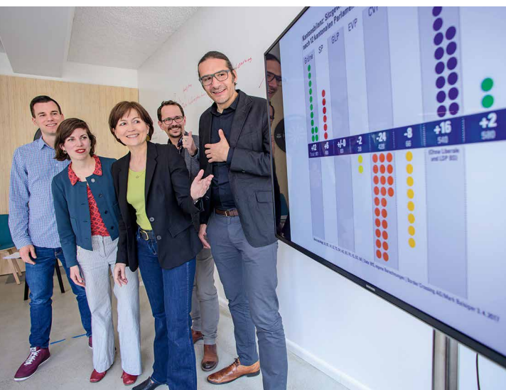
Erfreuliche Wahlerfolge zum Start der #GrüneDebatte17.

Die Grünen sind die fünftstärkste Partei in der Schweiz und haben in ihrer über 30-jährigen Geschichte viel bewegt. In einer Zeit der globalen Umbrüche diskutieren wir gemeinsam über die Weichenstellung für die Zukunft.