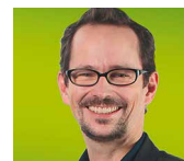
Balthasar Glättli Fraktionspräsident Grüne, Nationalrat ZH @balthasarglaettli